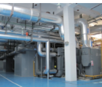
冷 / 热源站 多联供综合能源站

产业园区、新城、城镇区域.....中，风、光、储、充、冷、热、汽、气.....等能源生产供给场站